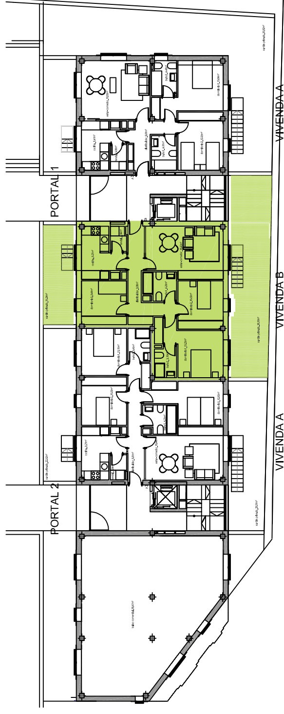
LOCALIZACIÓN DA VIVENDA NA PLANTA BAIXA E 1/250