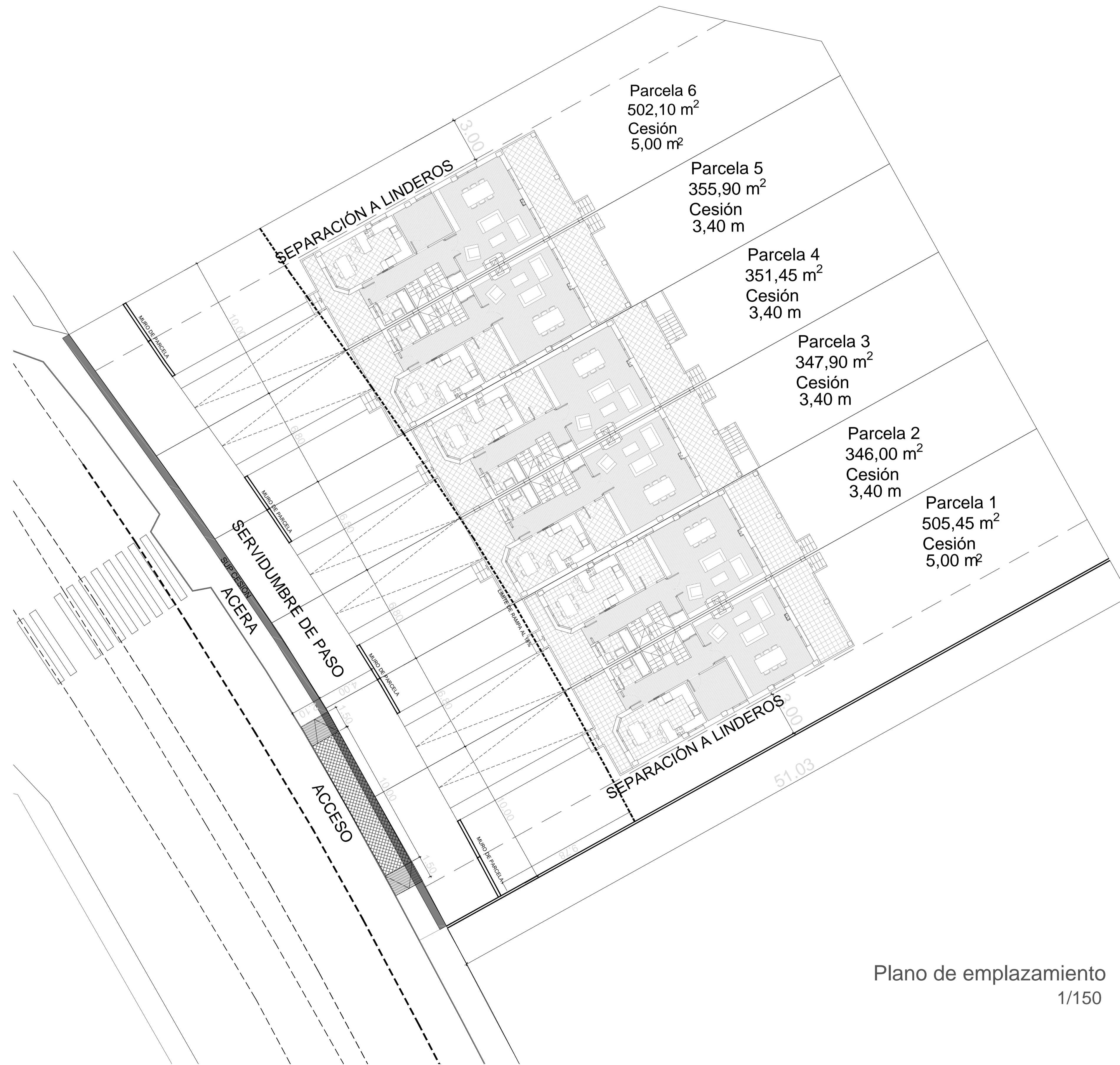
Plano de emplazamiento 1/150