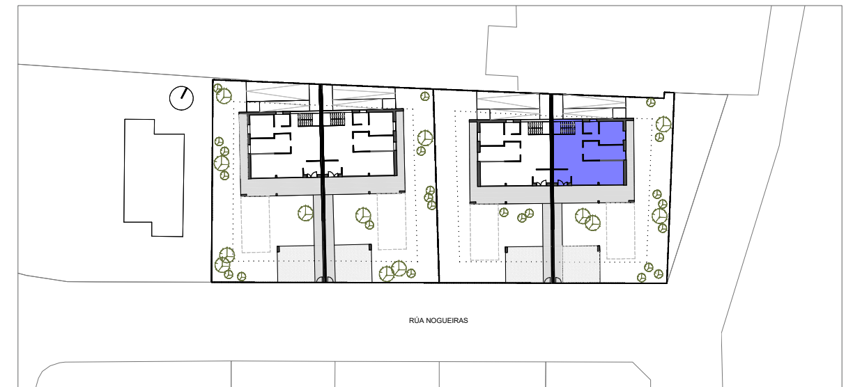
C/Nogueiras: vivienda A